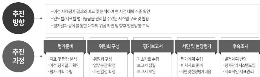
<그림 2> 자체평가 추진 방향 및 과정도